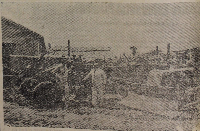
Vista parcial da garage e oficinas do competente construtor, vendo-se possante e moderníssima maquinária no pátio da garage, cuja dimensão é de 3.200 metros quadrados, numa área coberta de 740 metros quadrados. Escritório à rua Lisandro Nogueira, 1.655 — Teresina — Piauí. Endereço telegráfico: CAMINHÃO — Fone 3-5-6

Possuidora da maior equipe de máquinas «CATERPILLAR» no Estado, encarrega-se de construção de estradas, açudes, barragens, terraplenagens, perfuração de poços e outros serviços da especialidade.